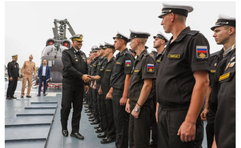
خبرنگار: فرزاد جوانمرد

بنابراین گزارش جمعی از کارکنان ناوگروه نیروی دریایی فدراسیون روسیه نیز در ادامه برنامه بازدیدها از کارخانجات نداجا و ناوشکن جمهوری اسلامی ایران جماران بازدید کردند.