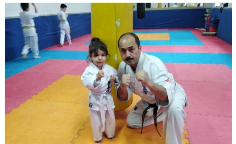
خبرنگار: مهدی رودگر

در دنیای امروز که چالش‌های اجتماعی، کم‌تحرکی، فشارهای روانی و فاصله گرفتن جوانان از سبک زندگی سالم بیش از هر زمان دیگری احساس می‌شود، ورزش نه تنها یک فعالیت جسمانی، بلکه ابزاری مؤثر برای سلامت جسم، تعادل روان و شکل‌گیری شخصیت اجتماعی به شمار می‌آید. ورزش می‌تواند مسیری امن برای هدایت انرژی جوانان، افزایش اعتماد به نفس، تقویت انضباط فردی و ایجاد روحیه مسئولیت‌پذیری باشد.